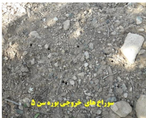
سوراخ های خروجی پوره سن ۵

پس از تکمیل سنین پورگی پوره های سن ۵ از خاک خارج شده