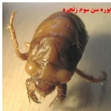
پوره سن سوم زنجره

دوره جنینی ۳۰ روز است و پس از گذشت این مدت زمان پوره سن یک ظاهر می شود و از روی شاخه به روی خاک می افتد. پوره سن یک به سرعت خود را از لابلای خاک و شکاف زمین به ریشه گیاه می رساند و از شیره آن تغذیه می کند. این آفت ۵ سن پورگی دارد و در طی این مدت بر روی ریشه گیاه تغذیه می کند.